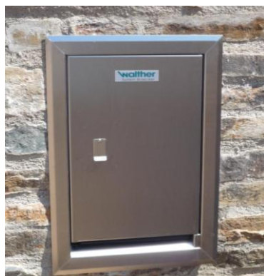
Coffret UP à encastrer pour intégration discrète

Coffret en acier inoxydable robuste avec finition de qualité