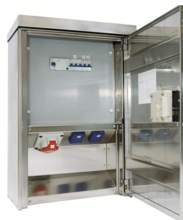
Coffret 8A pour fixation en saillie, pose facile